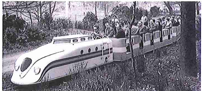
Am 15. März 1960 fuhr die Bahn zum ersten Mal durch den Deutsch-Französischen Garten.